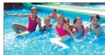
La Récré des 3 Curés