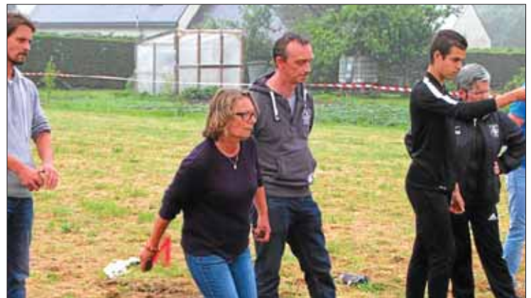
Soirée choucroute et concours de palets sur planche sur herbe