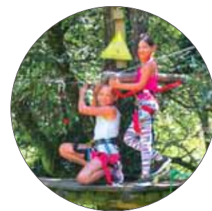
Accrobranches à Camors

En 2018, 277 enfants ont participé aux sorties et activités proposées par la municipalité pendant les vacances scolaires dans le cadre d'ATOUPS JEUNES.