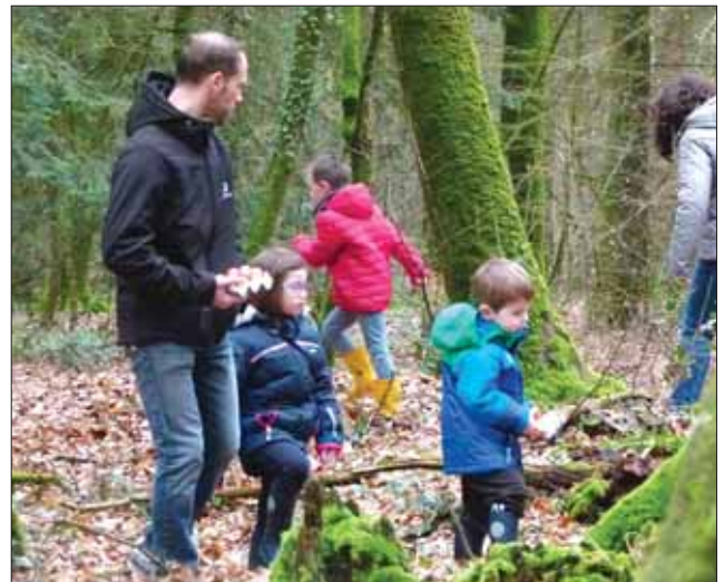
Une centaine de participants à l'œuf Party du mois de mars