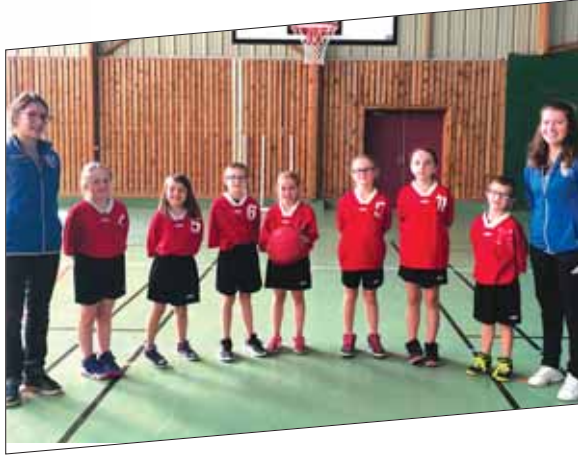
U9 Mixtes 1