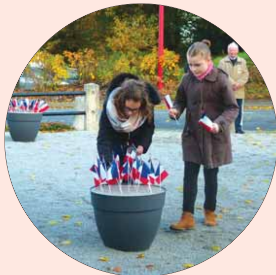
Inauguration des 3 nouvelles plaques