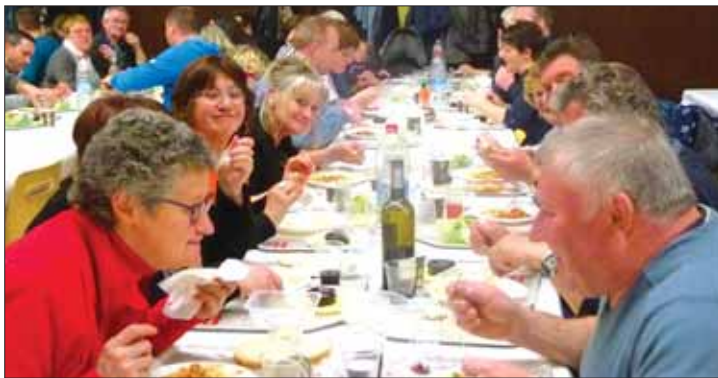
Repas de l'école