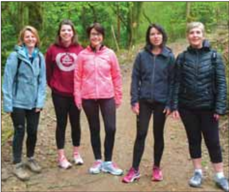
560 participants à la rando VTT pédestre du mois d'avril