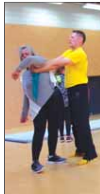
Self-défense féminine le 26 août 2018