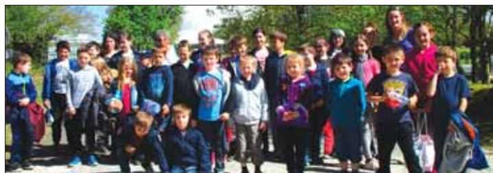
Parc du Radôme à Pleumeur-Bodou