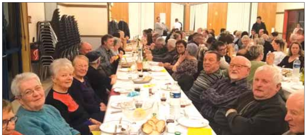
Repas des chasseurs