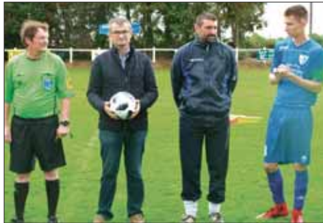
Remise d'un ballon par le maire