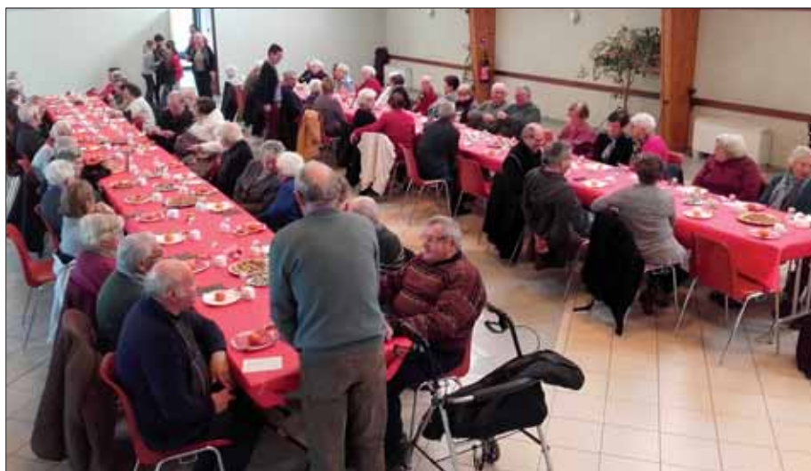
Goûter de Noël du Service Évangélique

Les membres du service évangélique offrent la possibilité de véhiculer les personnes âgées à la salle du Parc.