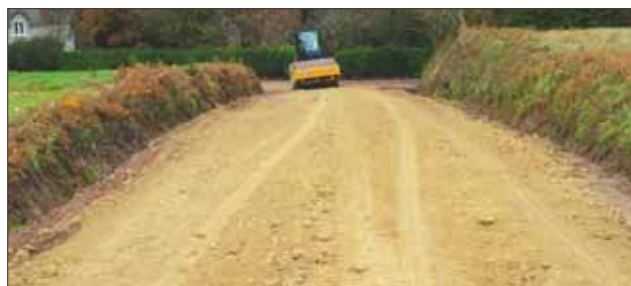
La Ville Benêt

Des travaux d'entretien ont été réalisés sur des chemins ruraux aux lieux-dits : La Ville Benêt, Le Fontainio, Coët By, Les Bourbalets, chemin d'exploitation du bas de Coët Méan vers le moto-cross, chemin d'exploitation reliant Les Brières d'En Haut à La Ville Guillemot. L'entreprise Picaud de Moréac a été retenue pour un montant de 120 € HT/l'heure (niveleuse + compactage).