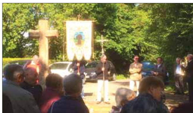
Pardon de St Gildas.

Les bénévoles remerciés par la municipalité pour leurs diverses implications dans les activités et animations communales.