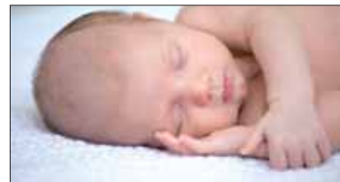
Publication de l'état civil suivant les autorisations des intéressés En 2018 22 naissances