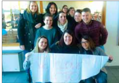
Loto, 450 personnes