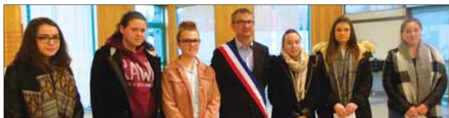
Cérémonie d'accueil des nouveaux arrivants, des 18 ans et des bébés 2017