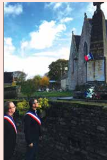
Dépôt de gerbes à Coët-Bugat et Trégranteur