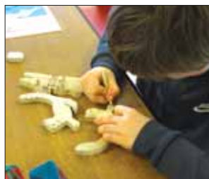
Jouets en bois