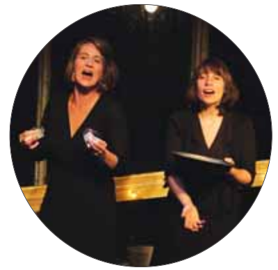
22/09/2018 - Duo du Bas, chanson polyglotte a capella