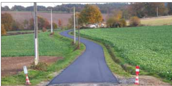
La Ville Royan