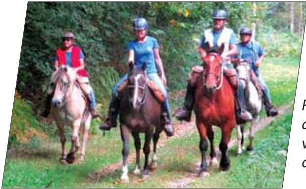
Rando dans la vallée du Sedon

18 e endurance équestre qui s'est déroulée les 17 et 18 mars 2018 150 participants