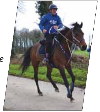
Cavaliers en rando dans les Monts d'Arrée

18 e endurance équestre qui s'est déroulée les 17 et 18 mars 2018 150 participants