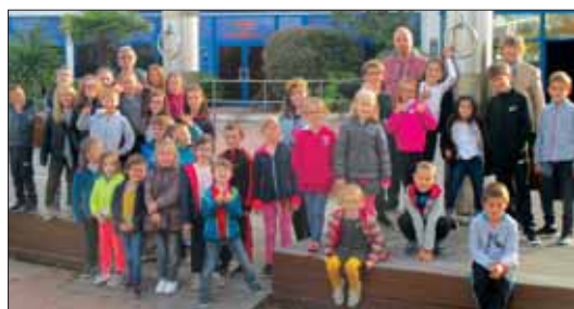
Aquarium de St Malo