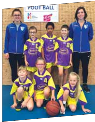
U9 Mixtes 2