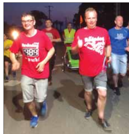
Passage de la Redadeg à Guégon le 6 mai