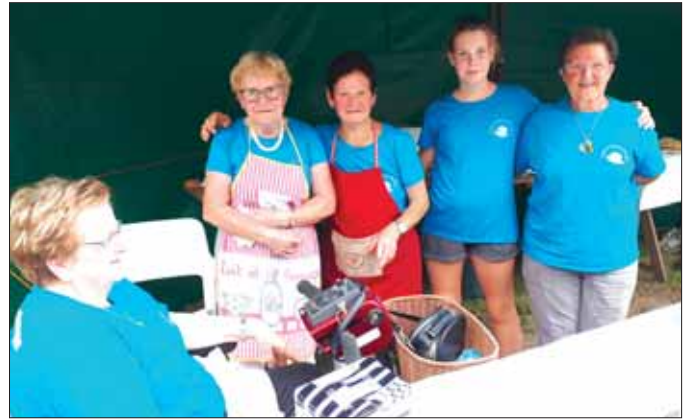
Fête champêtre du moulin de Penroc