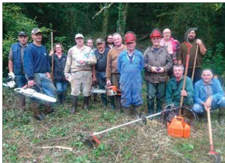
Nettoyage des cours d'eau par l'Hameçon josselinais

Lancé en 2018, le groupe de marche de Guégon se retrouve tous les jeudis à 14 h à la salle des sports pour partir à la découverte de Guégon et ses environs.