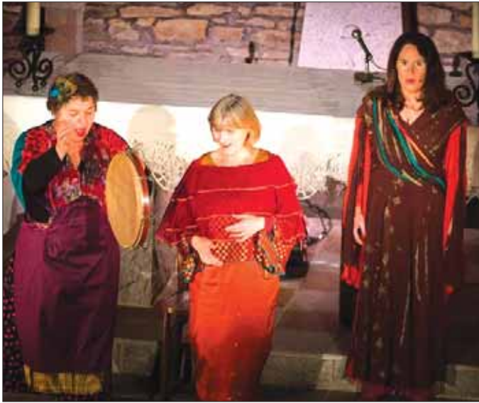
17/12/2017 - concert de Noël à l'église de Coët Bugat avec Les Elles du Vent, chants de partout et d'ici